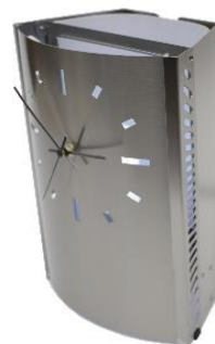
z. B. auch als Uhr möglich