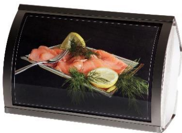
Abb. KL 36 mit Edelstahlrahmen