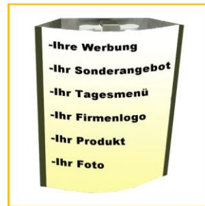
Verdeckter Insektenfang werbewirksam mit Ästhetischer Anmutung