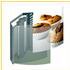
Ausdruck einfach zwischen 2 Acrylglasplatten legen