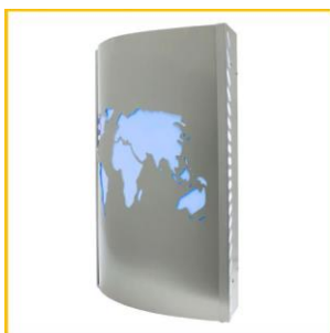
Hochwertige Edelstahlblenden, auch mit eigenen Motiven, erhältlich